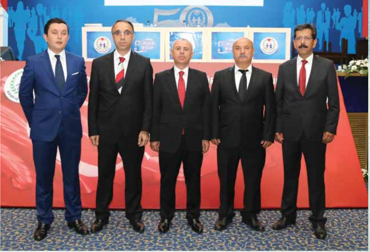
Koop-İş Sendikası 18. Olağan Genel Kurul sonunda oluşan Genel Merkez Yönetim Kurulu.

gerçekten inanamıyor. Nereden nereye gelmişiz. Neler yaşamış, ne badireler atlattığımız. Bugün çok farklı yerlerdeyiz. Binalarımız, araç gerecimiz, teknolojik imkanlarımız, her şeyimiz var. Ancak asıl ihtiyacımız olan Bundan 50 yıl önce Koop-İş'i kuruların sahip olduklarıdır. İnançtır, kararlılıktır, fedakârlıktır, azimdir, birliğimiz, bütünlüğümüzdür. Kimse tek başına bir güç değildir. Gücü birbirimizden alırız, zincirin halkaları gibi birbirimize iletiriz. Asıl olan, yağın yağmurda aynı şemsiyenin altında hep birlikte durabilmektir. Şemsiyeyi büyütme, daha çok kişiyi yağmurdan koruyabilmektir. Bunun için örgütlenmeye ihtiyacımız var. Büyümeye ihtiyacımız var. Unutmayın. Örgütlenmek özgürlüktür. Yeni bir doğumdur. Her gün, her an yeniden doğmaktır. Bu Genel Kurulda oluşacak yeni yönetim kurulumuzla üstleneceğimiz bu büyük emanetin hakkını vermek için, Koop-İş Sendikası'nın gücüne güç katmak için, Koop-İş topluluğuna ve ülkemize layık olabilmek için, Çok çalışmalı, kendimizi yenilemeli ve bilgiyle donatmalıyız. Gece gündüz demeden bütün gücümüzle çalışmaya devam etmeliyiz.