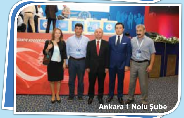
Ankara 1 Nolu Şube