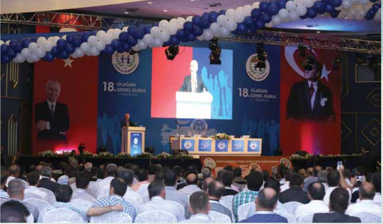
4-5 Ağustos 2014 tarihlerinde yapılan Koop-İş Sendikası 18. Olağan Genel Kurula yoğun bir katılım oldu.

Bu süreçte neler yaşamadık ki! Koop-İş Sendikası'nın büyümesini, güçlenmesini istemeyenler ellerinden geleni yaptılar. Çiçeklerimizi kopardılar, dallarımızı kırdılar. Ama baharın gelmesini engelleyemediler. İşte güneş yine açtı. Bahar geldi. Bahar Koop-İş'e geldi Koop-İş'e. Koop-İş'i baraj altında bırakmak isteyenler. İşkolunu bölmek, parçalamak isteyenler hüsrana uğradı. Biz baharı yaşarken, onlar fırtınaya tutuldu, fırtınaya.