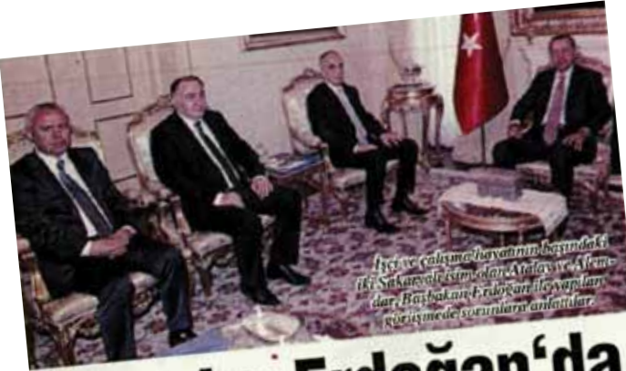
İçiş ve Çalışma Bakanlığı başındaki iki Sakarya valisi ile Erdoğan ve Alemdar Başkanları Erdoğan ile yapılan görüşmede sorunları anlattılar.